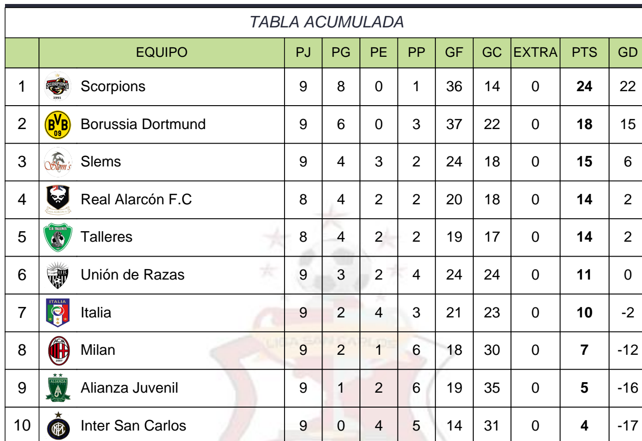
TABLA DE POSICIONES - CATEGORÍA MÁXIMA